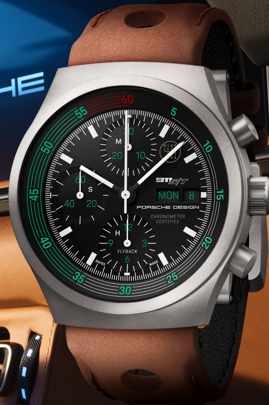
Chronograph 1 – 911 S/T Heritage