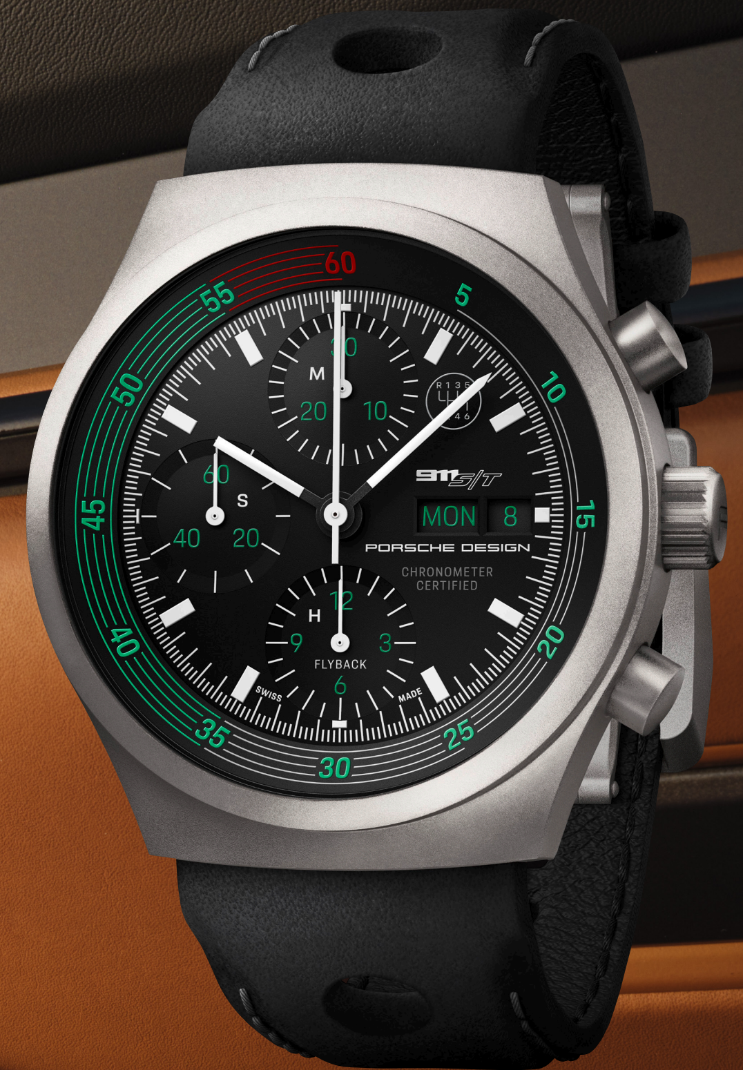
Chronograph 1 – 911 S/T